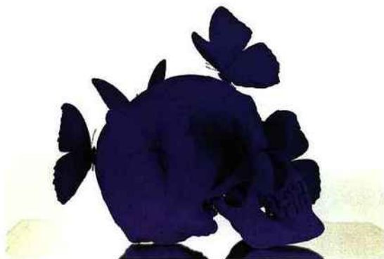
A gauche. Philippine (2010) témoigne de la relation de l'artiste avec l'être humain. Ci-dessus. Vanité pigmentée , une thématique récurrente des crânes humains. Ci-contre. Philippe Pasqua dans son atelier.